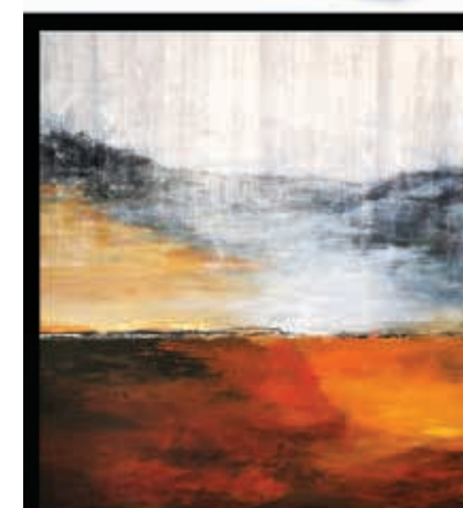
RED RIVER, 48 x 48po