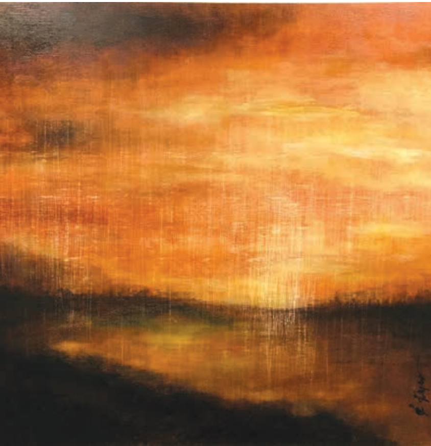
Tamise, acrylique sur panneau de bois, 24 x 24 po

Si ses premières toiles étaient produites avec des médiums classiques comme l'acrylique, le fini brillant, la spatule, il affirme se désintéresser de ses méthodes. L'Époxy, ce produit au fini très brillant et capricieux qui faisait rage il y a quelques années, a aussi fait son temps pour François Haguier. Les effets de doubles couches et de pluie qui se retrouvaient dans ses abstractions lyriques n'y sont plus. « Lors d'une exposition, j'ai réalisé que le reflet qu'il donne est au détriment de l'œuvre, comme si une partie n'est plus visible puisque la réflexion occupe l'espace sur la toile. »