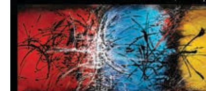
PARTITION LYRIQUE, 30 x 90po

Abstraction multiples par François HAGUIER